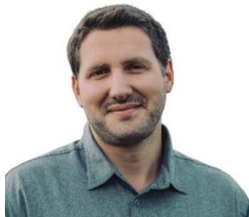
Chef de service Services Brossard Depuis 2021