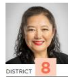
DISTRICT 8 Xixi LI SECTEURS O-N-I