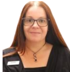
Cheffe d'équipe - Opérations Services Brossard Depuis 2013