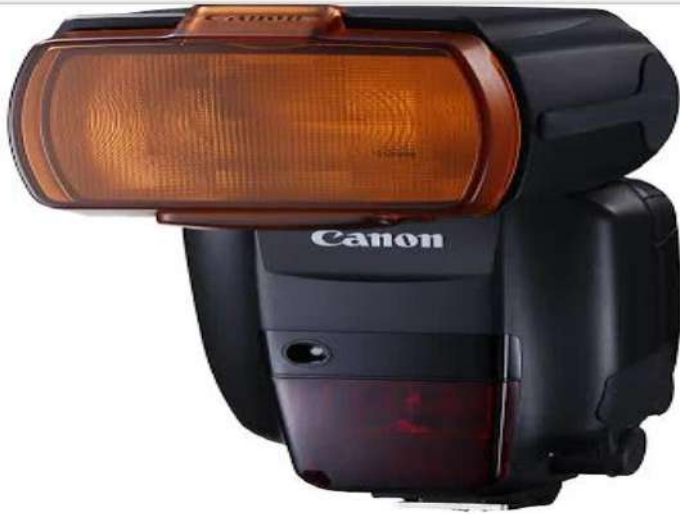
Canon 600EX II-RT Speedlite Flash