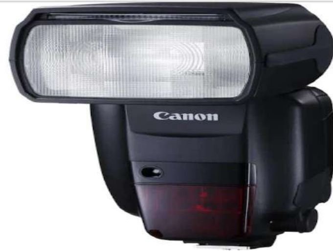
Canon Speedlite 600EX II-RT